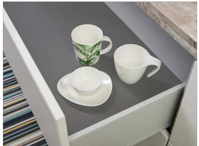
Rys. 5-1 RAUVISIO grip z oklejonymi krawędziami

Zwrócić szczególną uwagę na ustawienia cykliny płaskiej (klejowej) która z powodu właściwości antypoślizgowych powierzchni może ją zarysować. Zaleca się wcześniejsze wykonanie prób lub wyłączenie cykliny płaskiej.