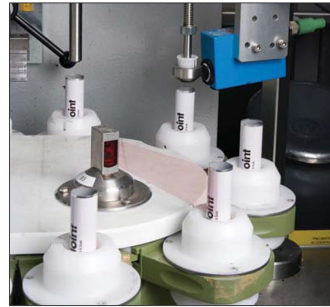
Wyprodukowano w Wielkiej Brytanii

ColorJoint jest dopasowanym kolorystycznie klejem i uszczelniaczem do łączenia blatów, montażu listew przyblatowych i paneli kuchennych. Używany jest również do montażu zlewozmywaków podwieszanych, a także uszczelniania wycięć pod zlewozmywaki oraz innych miejsc narażonych na działanie wody.