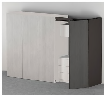
REVEGO duo Front podwójny prawy albo lewy