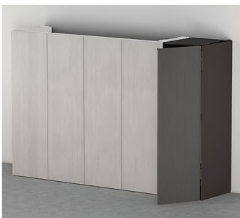
REVEGO uno Front pojedynczy prawy albo lewy