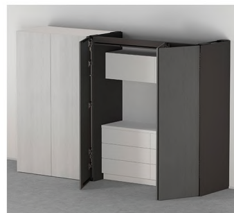
REVEGO uno + duo Front pojedynczy prawy albo lewy w połączeniu z frontem podwójnym prawym albo lewym