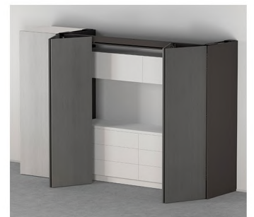
REVEGO duo + duo Połączenie dwóch podwójnych frontów