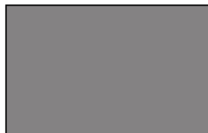
O171 BS Slate Grey