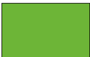
7190 BS Mamba Green