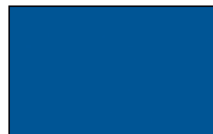
O125 BS Royal Blue