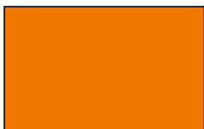
O132 BS Orange