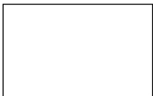
8685 BS Snow White